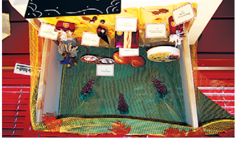
«L'Automne» par Emilie Dubath.