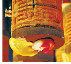
Finales romandes et tessinoises 2009