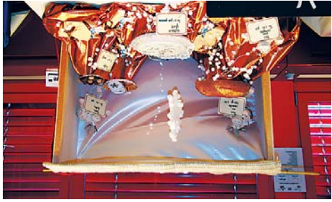
«L'Hiver» par Lella Emre.