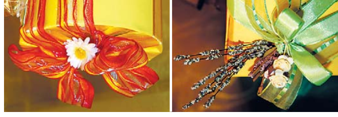
Ci-dessus, des détails printaniers du travail de la Jurassienne.