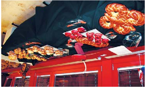
La mer et ses délices selon Sylvie Despont.