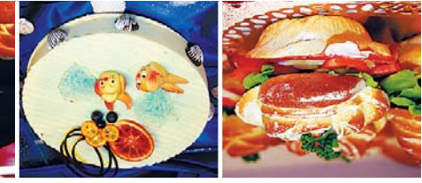
«Le Printemps» par Nadège Meyer.