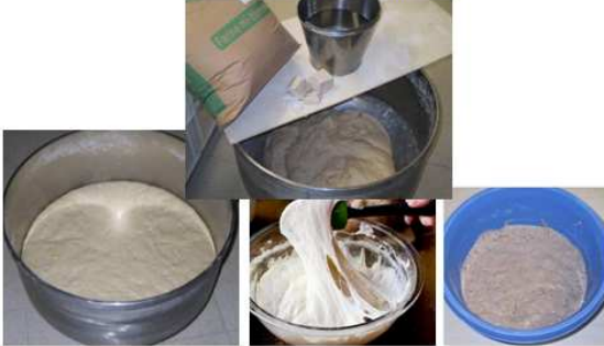
Levain du soir Contient de la levure de culture Poolish (liquide) Levain-chef Que des levures sauvages

Fermentation du levain en cuve (entre 1h et 8h, selon le résultat désiré) Pour multiplier les cellules de levure Pour dégrader l'amidon en malt (mie plus humide) Pour créer des acides lactiques (arômes) Pour créer des acides acétiques (lutte bactériologique)